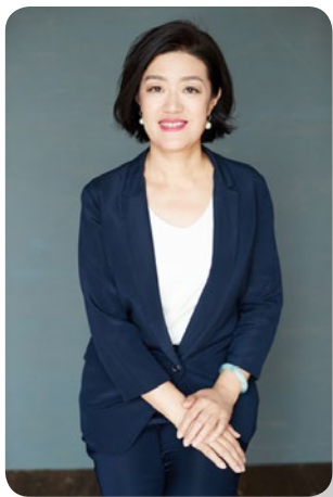
自“成为更优秀的 HRBP”的讲师