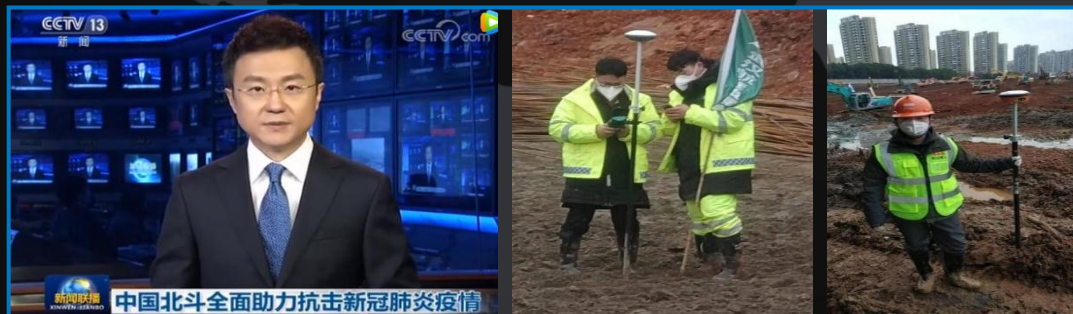
RTK测量终端火速驰援武汉火神山、雷神山医院建设 | 2020.2