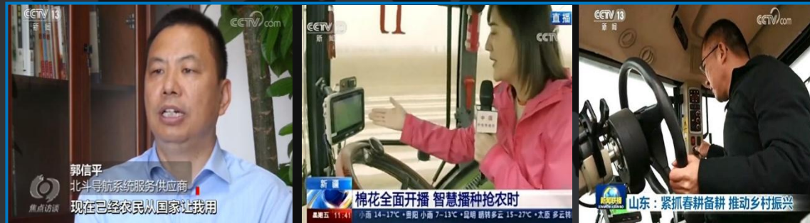
慧农®助力疫情期间春播屡登《新闻联播》 | 2020.04