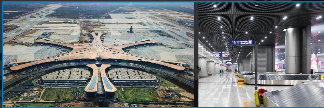
北京大兴国际机场室内外融合定位系统 | 2018.12