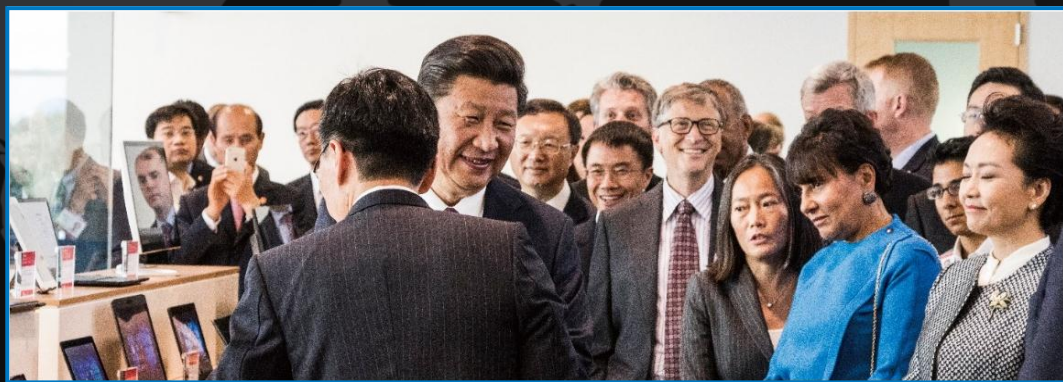
习近平主席访问微软参观合众思壮移动智能终端 | 2015.9