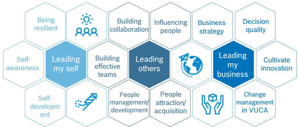
博世中国 领导力 发展指南