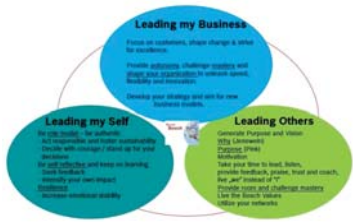
博世领导力能力模型