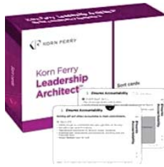
Korn Ferry "Leadership architect" 38个全球能力架构模型