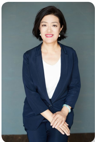
自“成为更优秀的 HRBP”的讲师