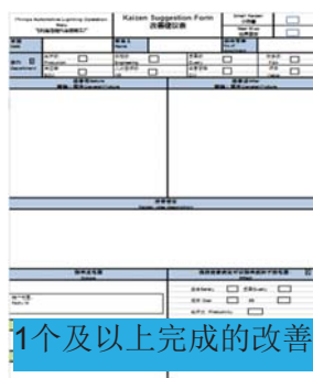
1个及以上完成的改善