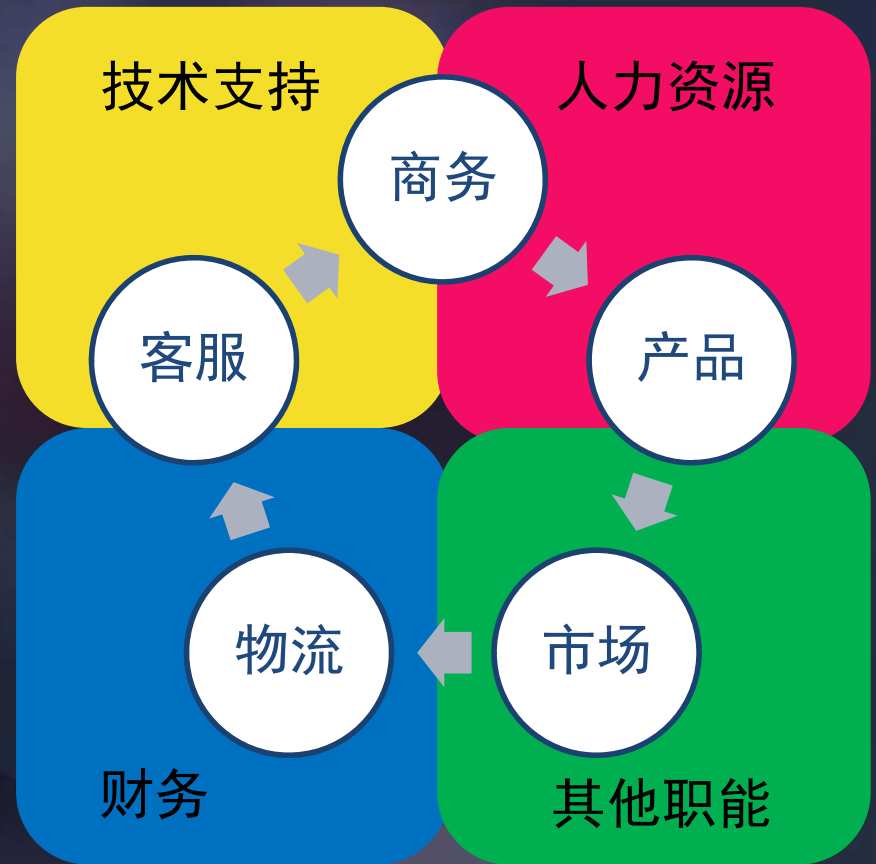
图二 唯品会主要业务部门