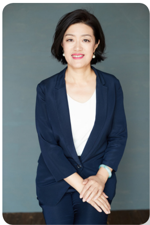
自“成为更优秀的 HRBP”的讲师